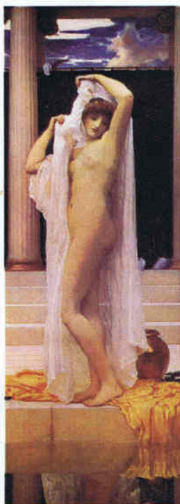
Lord Frederick Leighton The Bath of Psyche , c. 1890 Oil on canvas 189.2 x 62.2 cm Tate Gallery, London, England

Den store udstilling på V&A viste med al tydelighed, at victorianerne var storslåede mennesker, som en mere smalsporet eftertid har opfattet som snæversynede. Både i egentlig forstand og i mere overført var de grænseoverskridende. Vi investerede i kataloget for udstillingen, som er et orgie af billeder og originale tekster om kunst, kultur, politik og samfundsforhold, og vi låner det gerne ud. En formidabel billedbog, der - i lighed med udstillingen - fejrer hundredåret for Dronning Victorias fødsel.